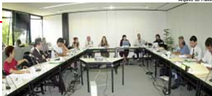
Na foto a 34ª Reunião do Conselho deliberativo do FNMA.