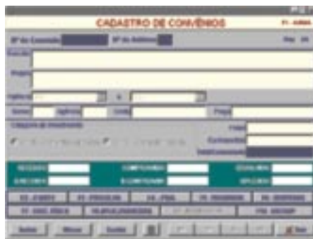
Apresentação visual do Sispec na página do FNMA.

Tal aplicativo poderá ser obtido diretamente da página do Ministério do Meio Ambiente: www.mma.gov.br (ver no link do FNMA – Fundo Nacional do Meio Ambiente). Ao inserir os dados que serão solicitados pelo sistema, o executor do projeto poderá gerar automaticamente os relatórios exigidos na presta-